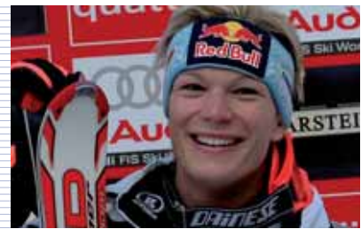
[ Maria Riesch ]

Vielen Dank wieder an alle Helfer für den zuverlässigen Einsatz bei allen Veranstaltungen; insbesondere auch an unsere beiden Damen in der Geschäftsstelle.