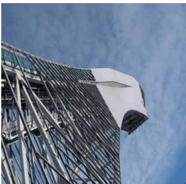
Impressionen aus der vergangenen Saison