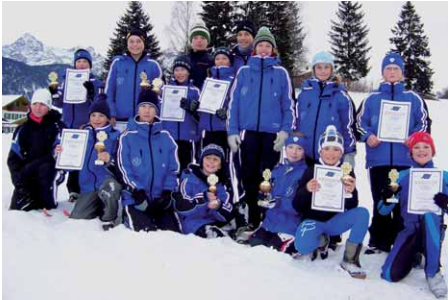
LL-Team Skiclub Partenkirchen