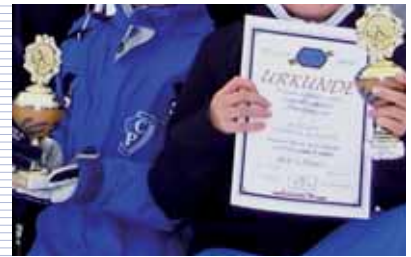
[ Anerkennung ]